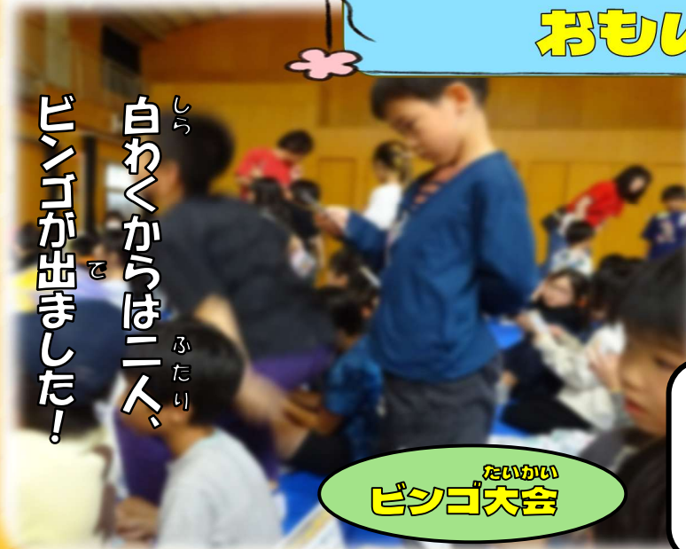
なかまだひろばの おもいで