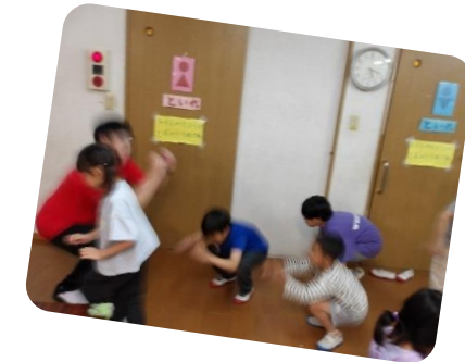
みんなでスクワット 1!2!1!2!