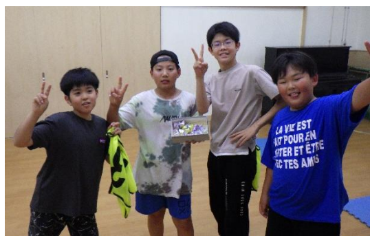
6月4日～ハントフラッグ～ 「ピーナッツくん」チーム