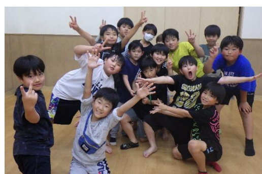
6月11日～ドッジボール大会～ 「チーム友達サイドステップ」チーム