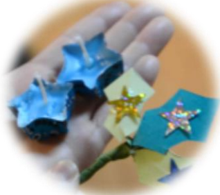
ワークショップで作った星型ロウソクとヒイラギ飾り