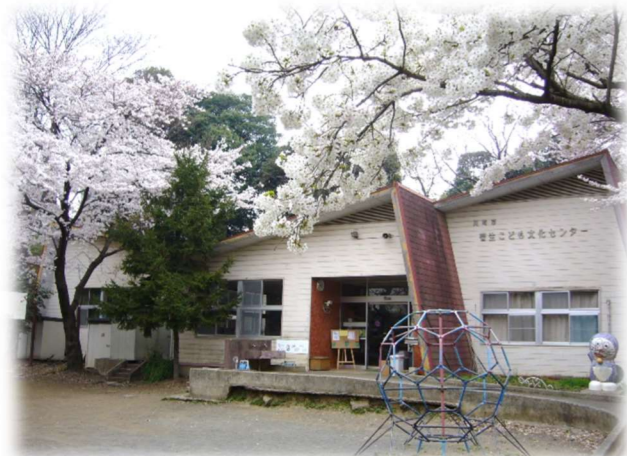
桜にかこまれる、初代菅生こども文化センター

私は二代目。上は先代の写真。1975年5月17日生れ。どうです？ 当時としてはモダンな建物ではありませんか？ 山小屋風で赤い三角屋根が斬新ですよ。写っている桜は、先代が誕生した時に植えられたもの。今でも春を彩っています。