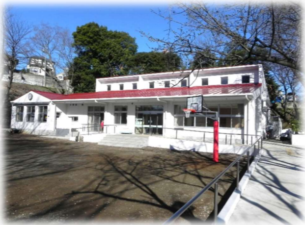
現在の、二代目菅生こども文化センター

今、みんなが感染予防に頑張っている。早く皆さんが集えるようになりますように。そうしたら、またみなさんと、いっぱい楽しいことができると、わくわくしています。私も頑張りますので、どうぞ、変わらずに来てください。よろしくお願いします。