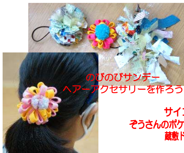
のびのびサンデー ヘアアクセサリを作ろう