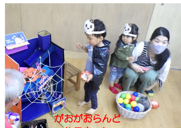
ががおらんど ハロウィン