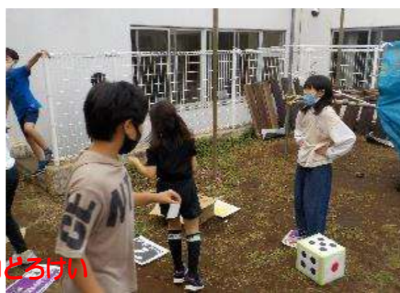
サイコロどろけい ぞうさんのポケット 蔵敷ドッチボール大会