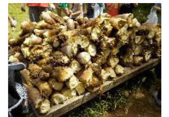
【下】 みんなが掘った大量の筍たち