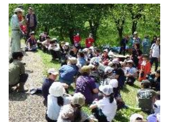
【上】 筍のお話しを聞く子どもたち

当日は、気温が上がって子どもたちの体力が心配でしたが、みんな元気にこども文化センターへ帰ってきて、「大変だったけど楽しかった」などの感想がありました。