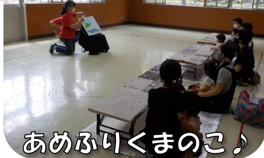
あめふりくまのこ♪