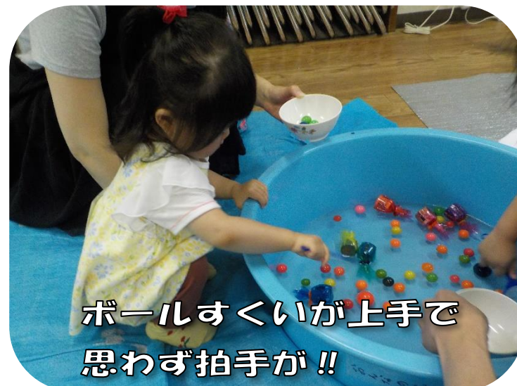
ボールすくいが上手で 思わず拍手が!!