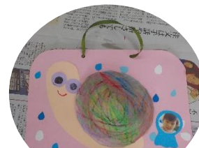
素敵なかたつくりが出来上がっていました♪