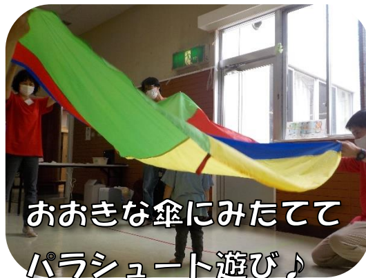
おおきな傘にみたてて パラシュート遊び♪