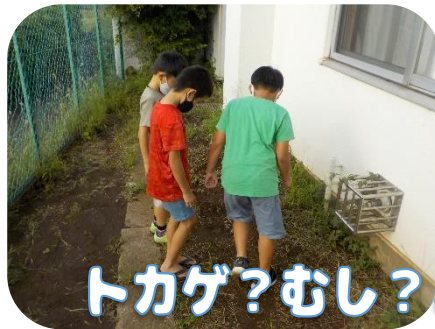
トカゲ?むし?どこかな...