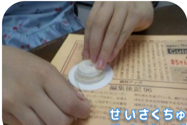
せいさくちゅう クラフト制作中...