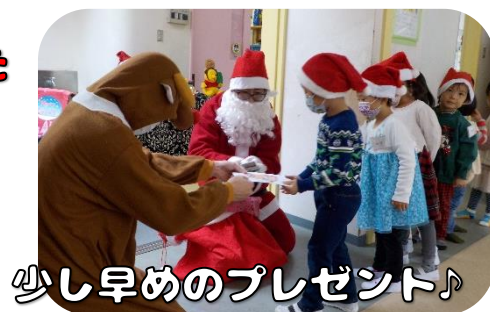
少し早めのプレゼント♪

雨の中、沢山のお友達が参加してくれました。読み聞かせをしてたら、隣の部屋から綺麗なベルの音が!? みんなで行ってみるとなんとサンタさんとトナカイさんがいて、たくさんあそんでくれました!!