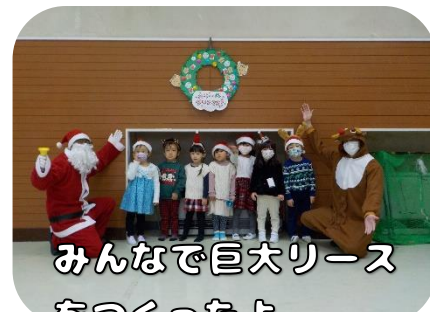
みんなで巨大リースをつかったよ。