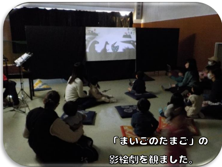
「まいごのたまご」の影絵劇を観ました。