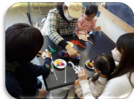
お土産用に、恐竜の影絵工作を作りました。