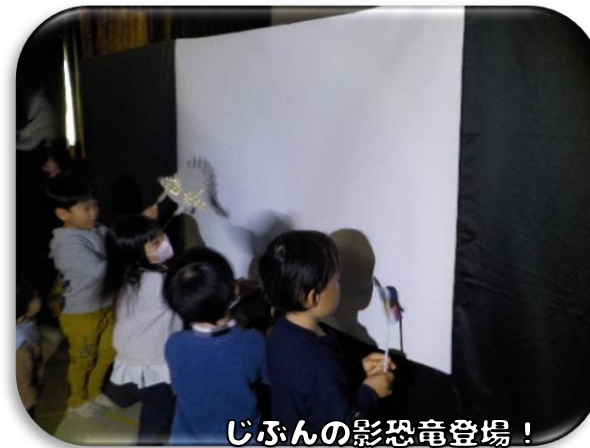
じぶんの影恐竜登場！