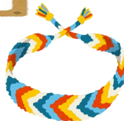
イラストはイメージです。