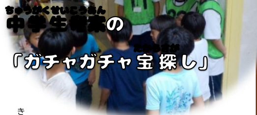
ちゅうがくせいこうもん 中学生部会の