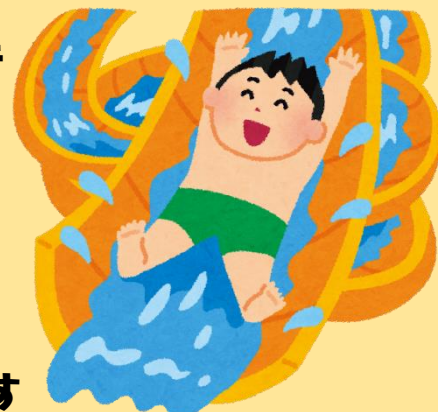
イラストはイメージです。