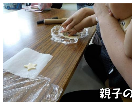
親子の手でぺったん