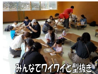
みんなでワイワイと型抜き