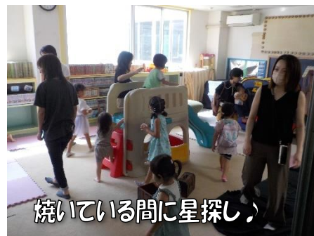
焼いている間に星探し♪