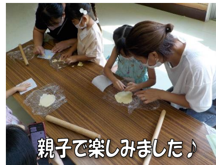
親子で楽しみました♪