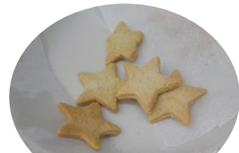
完成したクッキー♪