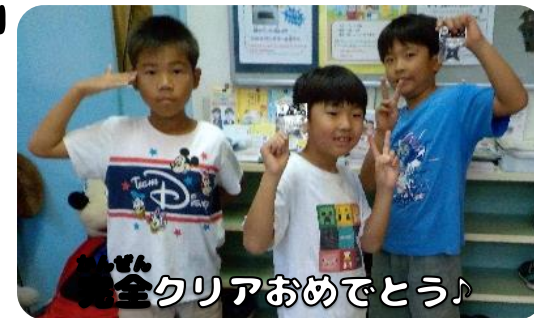
全クリアおめでとう!