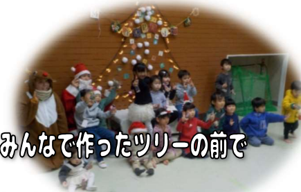
みんなで作ったツリーの前で