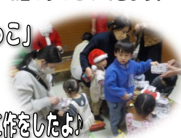
サンタさんと工作をしたよ!