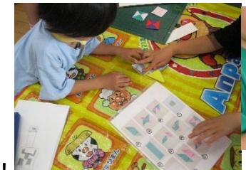
ぶんぶんごまこうさく