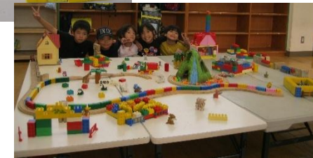
おおきなまちができたよ!